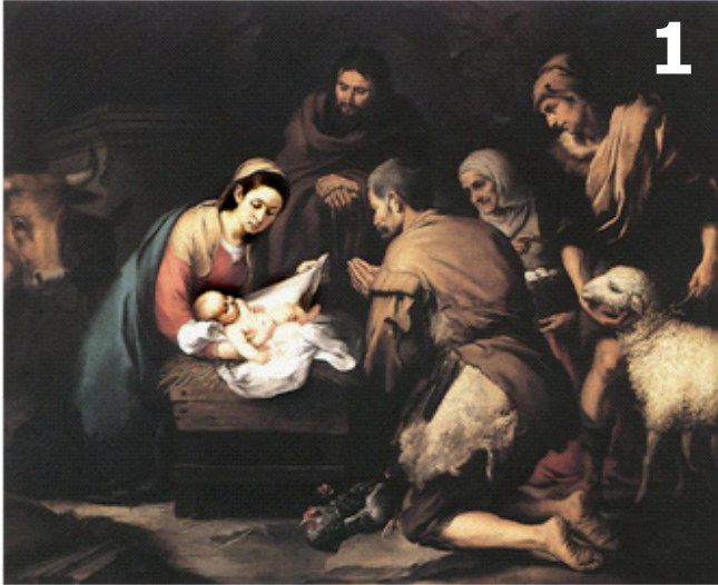
(Bartolome Murillo, Aanbidding van de herders, ca. 1650-'55)