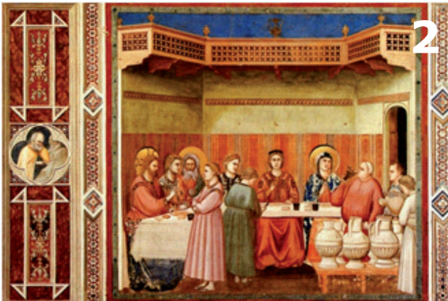
(Giotto, Bruiloft te Kana, ca. 1304-1306)